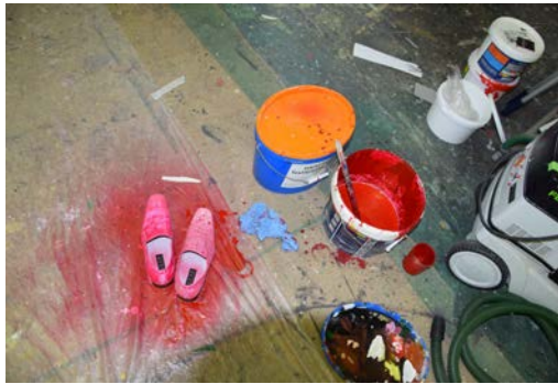
Abbildung 4: Die Schuhe des Teufels

Das Bühnenbild von Faust ist insofern besonders und aufwändig, dass es so konzipiert sein muss, dass alle Farben zusammenpassen. Dabei sollen beispielsweise die Kostüme in derselben Farbe sein wie die Vorhänge. Aber auch Requisiten wie Schuhe oder Trinkgefäße werden farblich angepasst. Die Farben werden von einer Firma geliefert und der Maler mischt die Proben so lange, bis sie mit der gewünschten Farbe übereinstimmen.