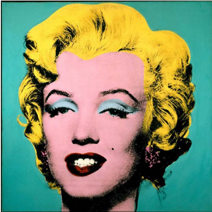
Abbildung 6: Andy Warhols Marilyn Monroe Kunstwerk