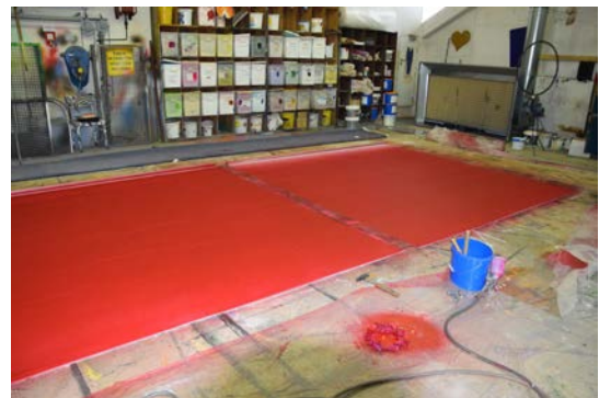
Abbildung 5: Bühnenbild Hintergrund

Es werden viele unterschiedliche Farben und auch Lack benutzt. Dabei sind Farben wie Rot besonders schwierig, während schwarz oder Pastellfarben mit weiß sehr gut decken. Die Aufgabe des Malers ist es also dafür zu sorgen, dass die Kostüme, die Leinwand und die Requisiten farblich zueinanderpassen.